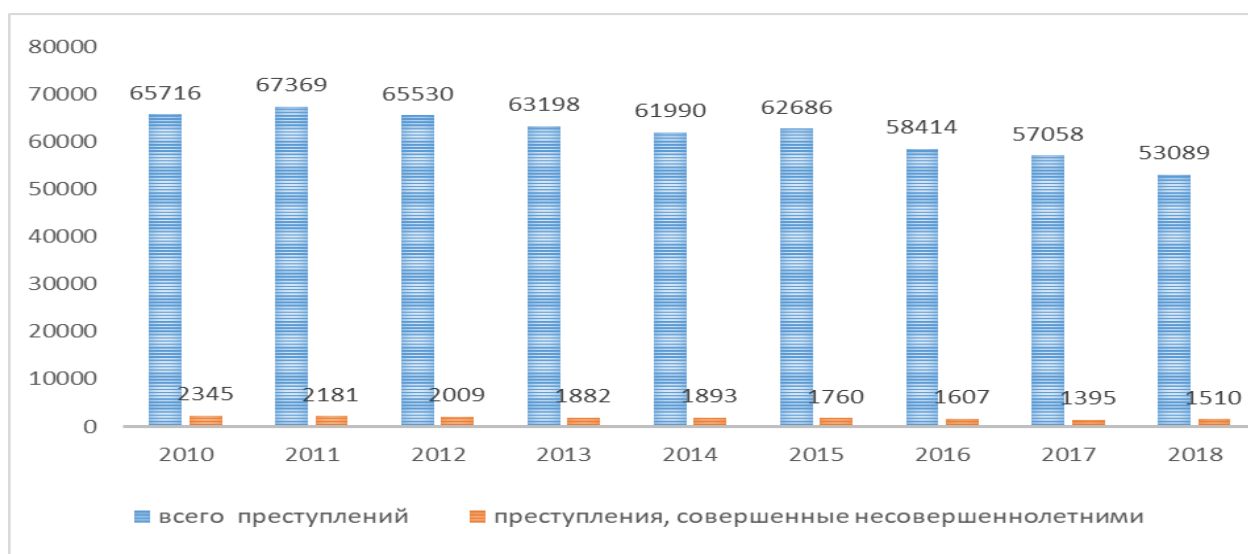
Рисунок 1 – Динамика преступлений, совершенных в Кемеровской области

Как видно на рисунке 1, количество преступлений в Кемеровской области за период снизилось на 12 627 ед. Особенно резкое сокращение пришлось с 2015 по 2016 гг. Одной из причин этого является декриминализация некоторых составов преступления.