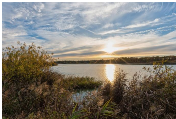
Ива и травы

Особую ценность представляют участки реликтовых дубрав, сохранившиеся в центральной части Артёмовских лугов.