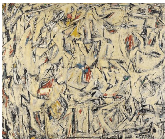
Рисунок 3-Виллем Де Кунинг,Раскопки, 1950

Смешанные техники открывают художникам новые возможности для выражения сложных эмоций[3]. Комбинация акриловых красок, текстурных материалов, коллажа и цифровых элементов позволяет создавать уникальные произведения, которые выходят за пределы традиционных подходов. Такие техники усиливают эмоциональную выразительность работ, делая их многослойными и насыщенными Рисунок 3