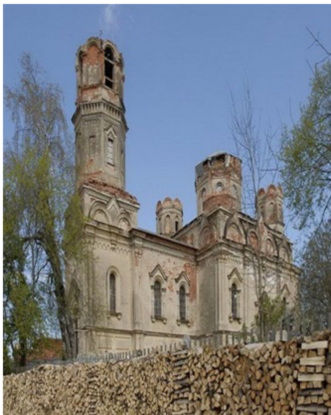
Рисунок 2. Александро-Невский монастырь.