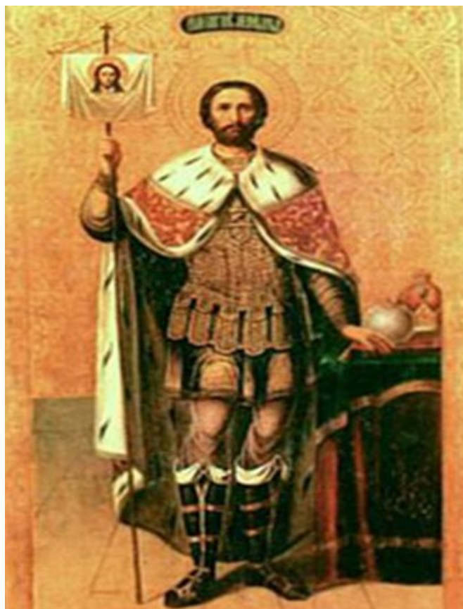
Рисунок 4. Икона святого благоверного великого князя Александра Невского.

Образ Александра Невского запечатлен во многих произведениях искусства: в живописи, скульптуре, музыке и кино.