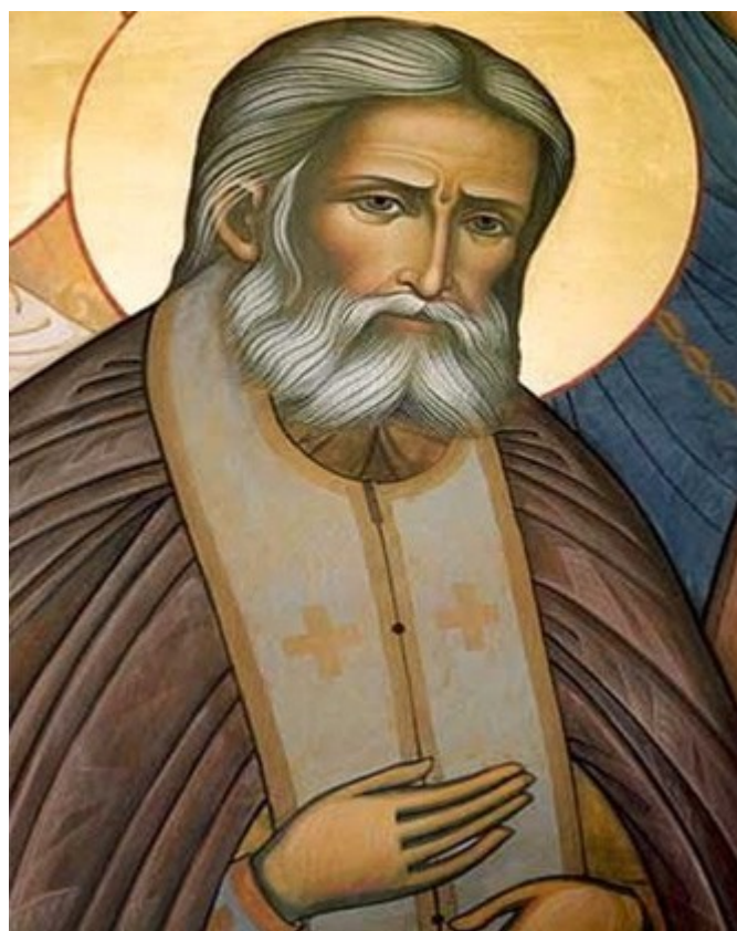
Рисунок 3. Роспись храма Александра Невского.