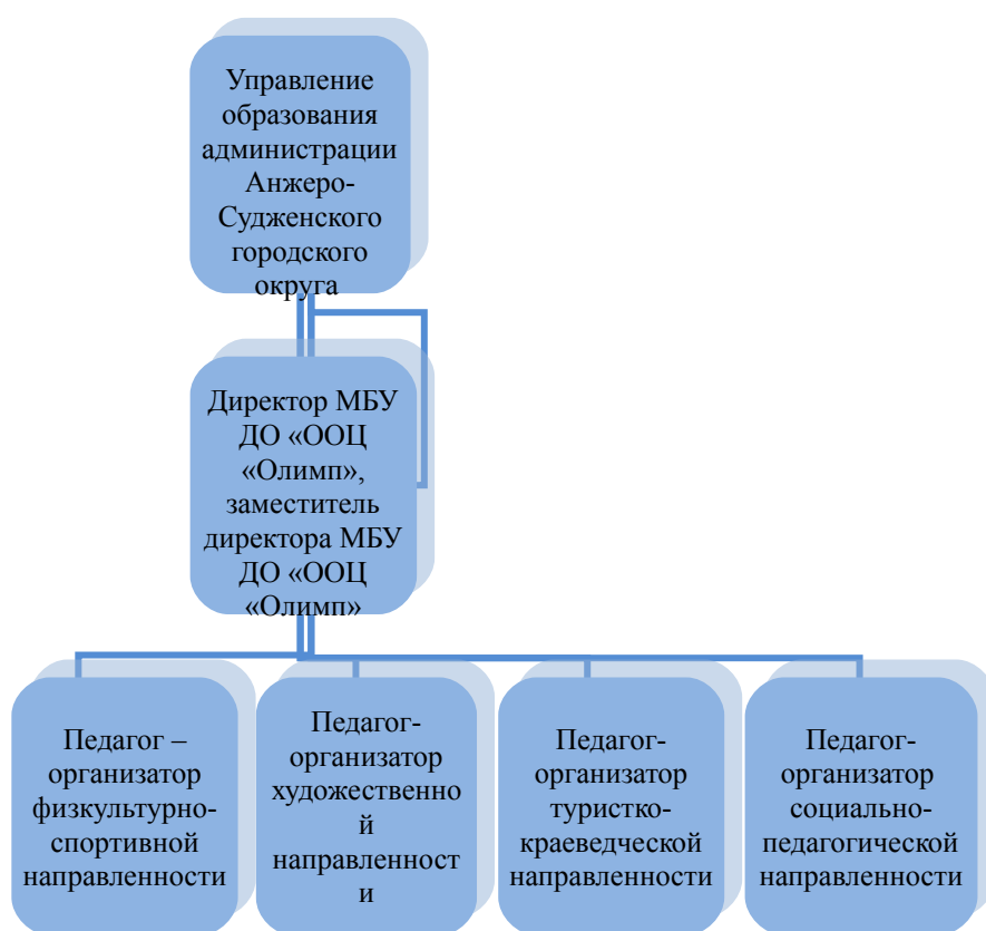
Рис.2 Система управления программой

Функционирование программы обусловлено четко выстроенной системой управления программой, в соответствии с которой осуществляется контроль за реализацией программных мероприятий (Рисунок 2).