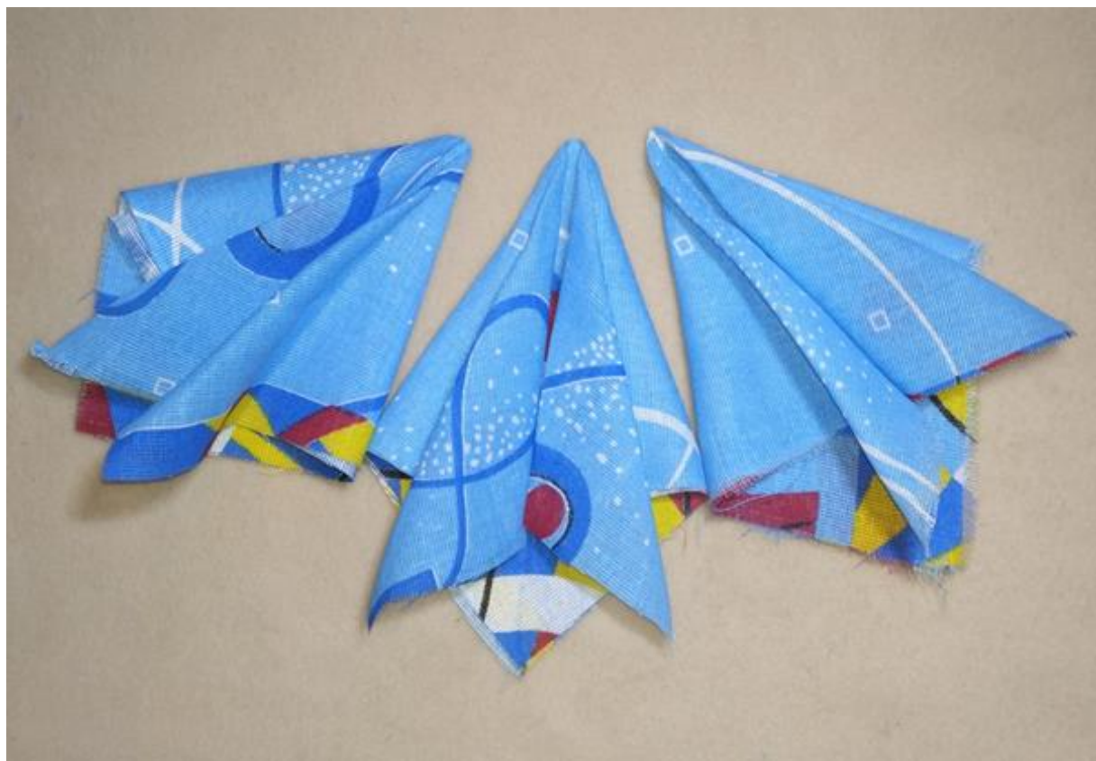
Детали спинки сарафана в готовом виде