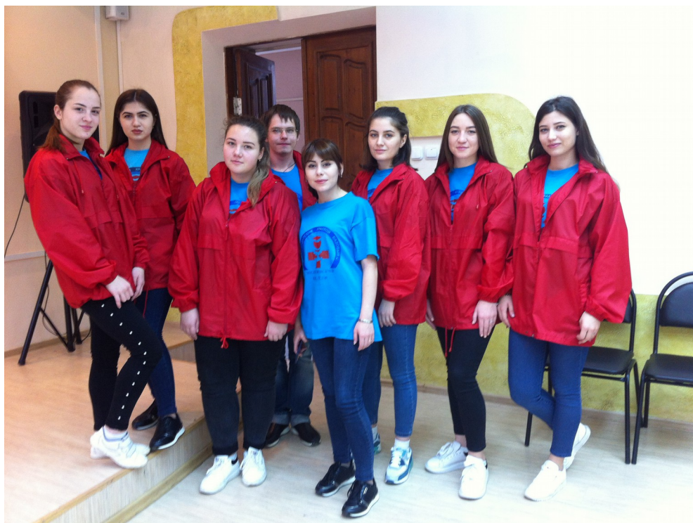
Волонтеры – студенты группы Лаб/д-41 специальности Лабораторная диагностика