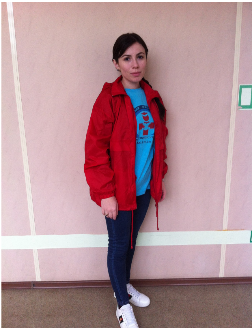
Форма волонтера отборочных соревнований «Молодые профессионалы» WSR Лабораторный медицинский анализ