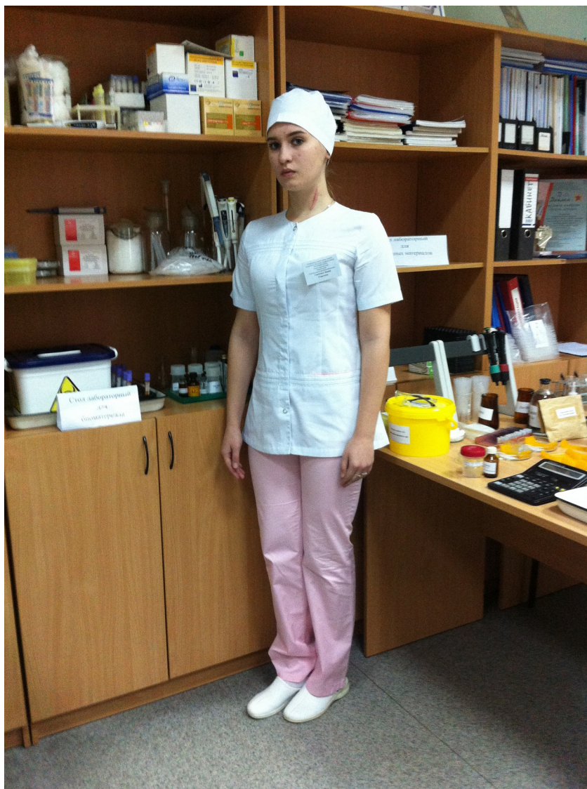
Форма участника отборочных соревнований «Молодые профессионалы» WSR Лабораторный медицинский анализ