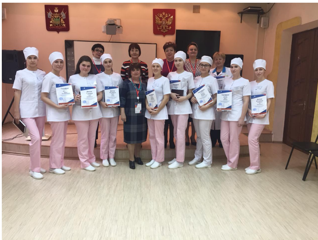
Команда участников и эксперты конкурса «Молодые профессионалы» Заккрытие предметной недели ЦК Лабораторная диагностика