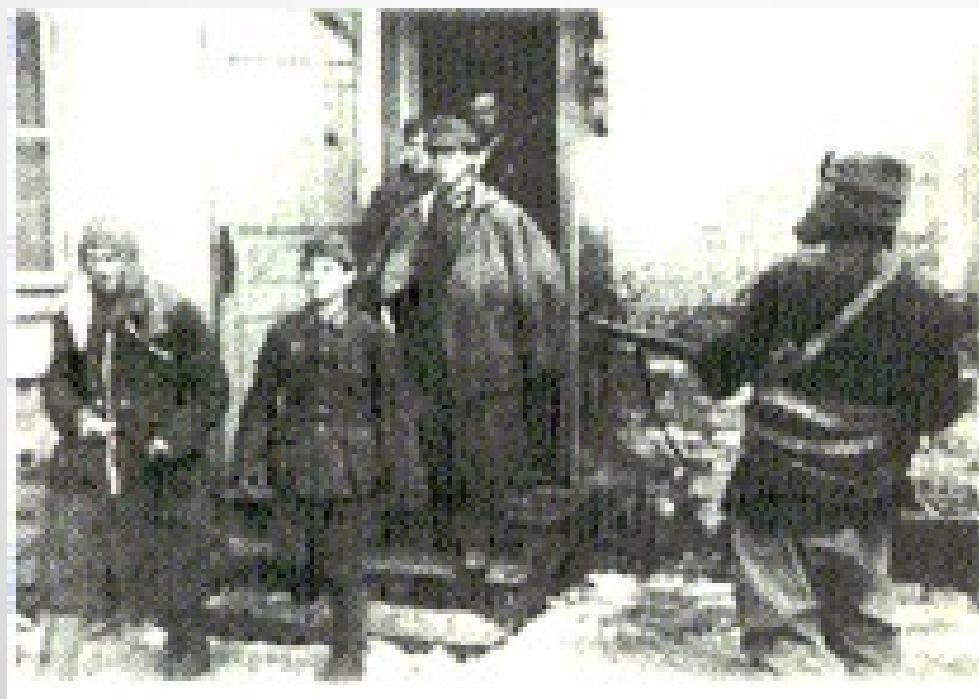
Румынские солдаты в плену у партизан. Кубань, начало 1943 г.