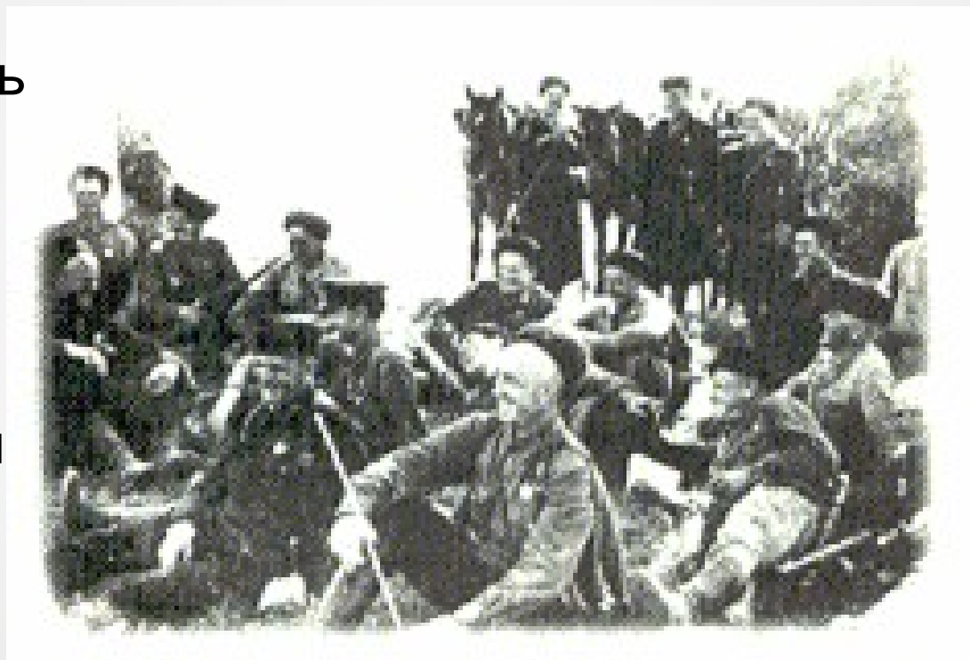
Бойцы 4-го Кубанского гвардейского кавалерийского корпуса на привале. 1942г.

К июлю 1942 г., когда война пришла на землю Кубани, каждый пятый житель края ушел на фронт. Из добровольцев было создано более 90 истребительных батальонов и три казачьих соединения – 50-я отдельная кавалерийская дивизия, 4-й Кубанский гвардейский кавалерийский корпус и Краснодарская пластунская дивизия.