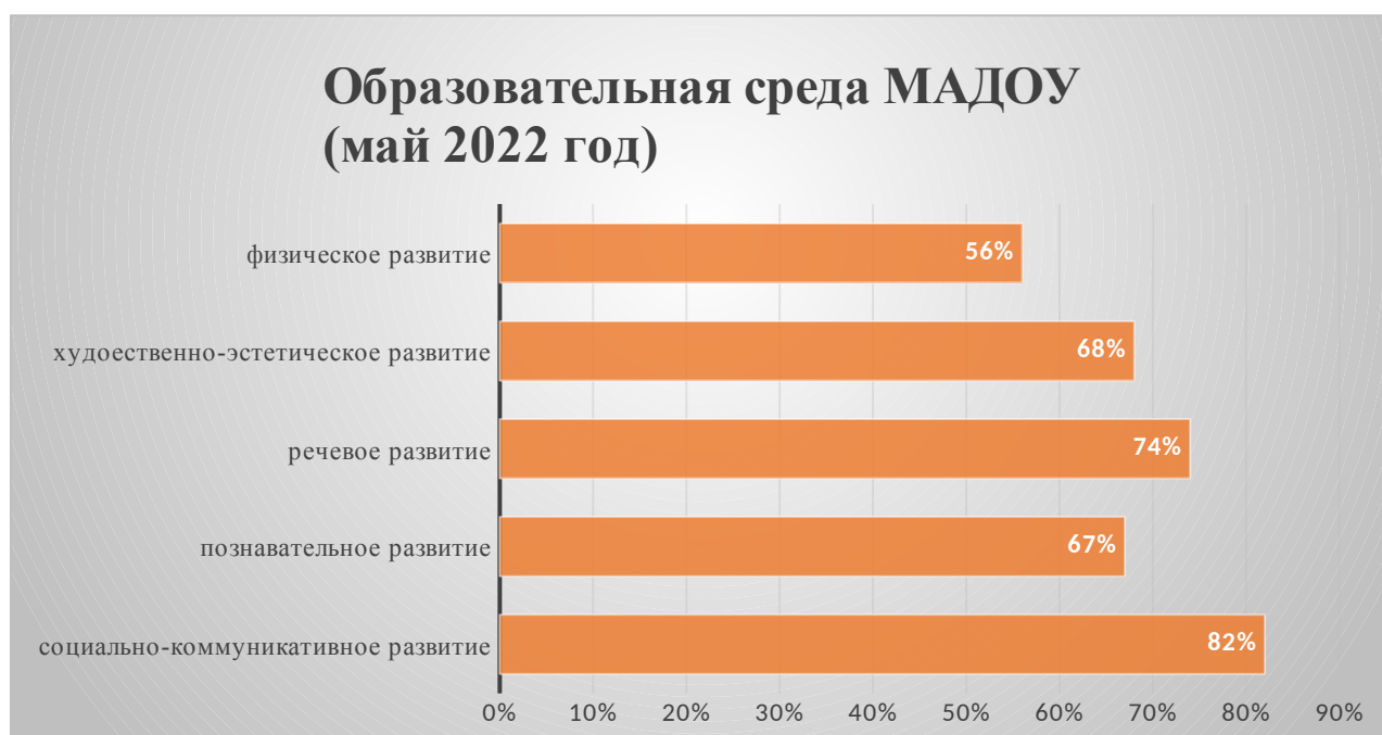
Диаграмма 1. Мониторинг образовательной среды в МАДОУ «Центр развития ребенка – детский сад «Сказка» г. Белоярский» (конец учебного года).

По результатам мониторинга образовательной среды МАДОУ можно сделать вывод, что организация музейного пространства в МАДОУ играет большую познавательную и воспитательную роль для дошкольников, а также способствует укреплению сотрудничества детского сада и семьи. Практика показывает, что создание мини-музеев способствует возникновению интереса, как у детей, так и у взрослых желания узнать больше. Это подтверждают рассказы воспитанников о посещениях в выходные дни выставок, залов краеведческого музея, а также активная помощь родителей в подборе