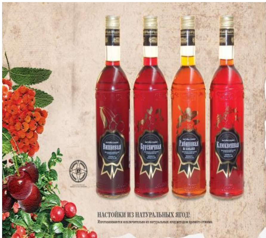
НАСТОЙКИ ИЗ НАТУРАЛЬНЫХ ЯГОД! Изготавливаются исключительно из натуральных ягод методом прямого отжима.

Настойки сладкие готовят с использованием спиртованных плодово-ягодных соков, морсов, ароматных спиртов. Содержание сахара ниже, чем у наливок (8-30 г/100 см 3 ), вследствие чего сладкий вкус у них менее выражен, чем у наливок.