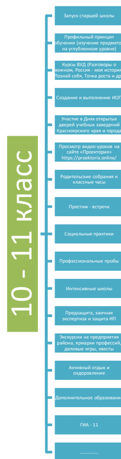
рис. ГЭ - 3

Хочется представить механизмы управления выстраиванием образовательной траектории обучающихся, акцентируя внимание на формировании внутрипрофильной специализации.