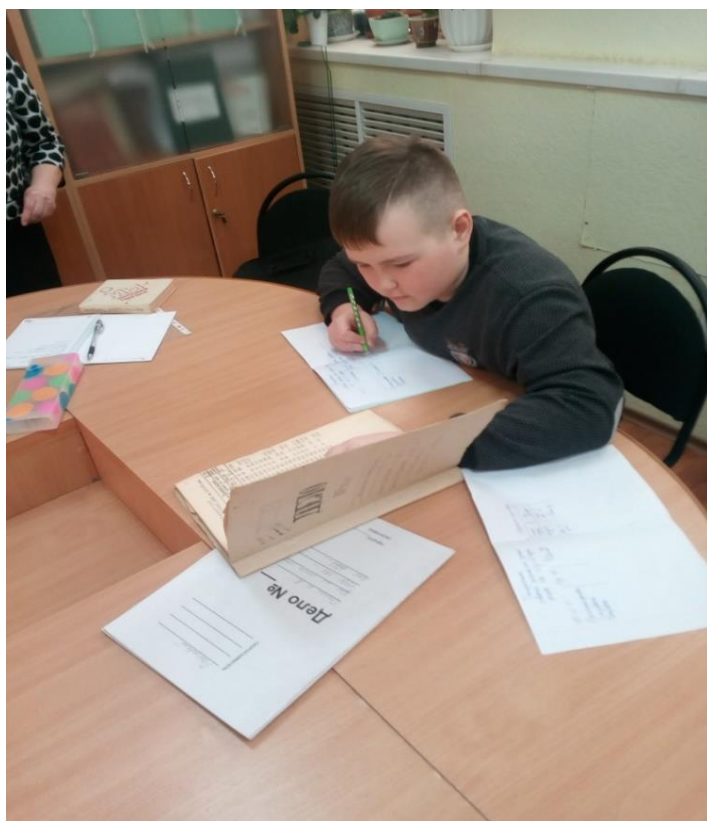
Работа в архивном отделе Администрации МО «Воткинского района»