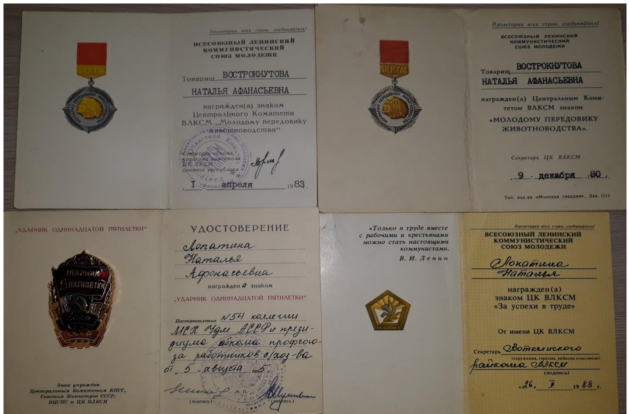
Награды Лопатиной Натальи Афонасьевны