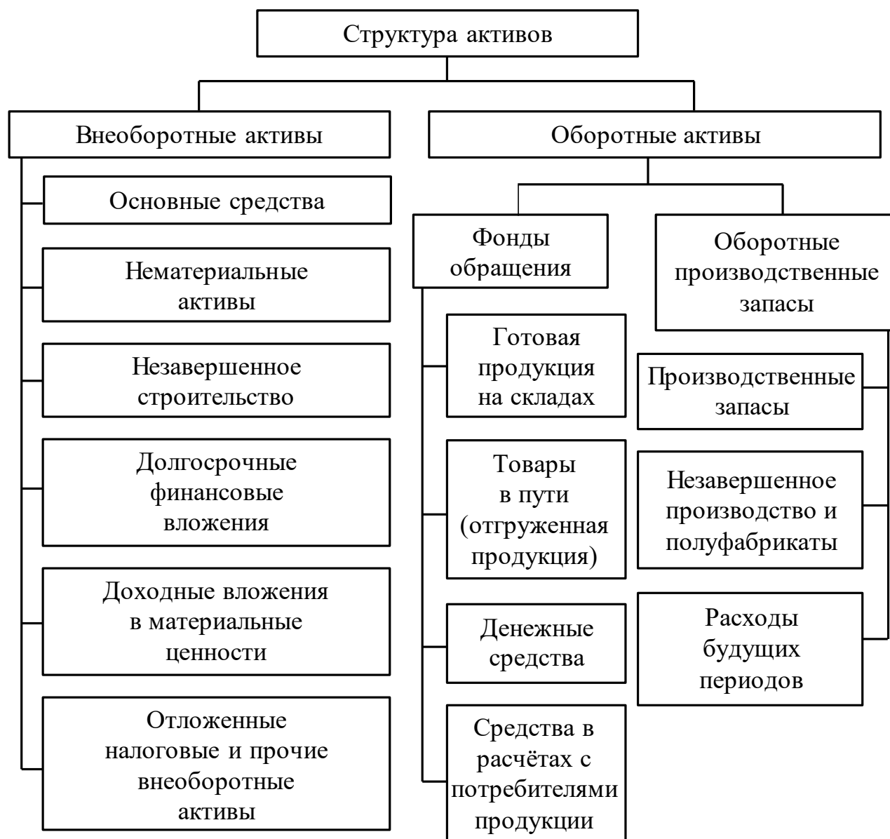
Рис. 1 - Структура активов предприятия